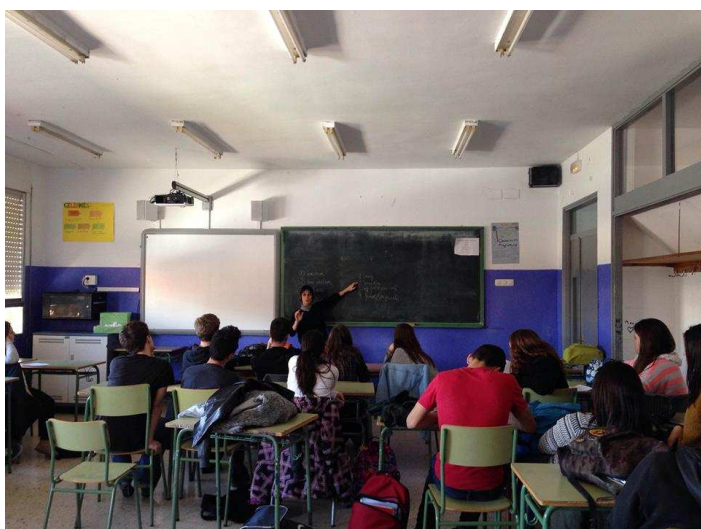
Tallers de Salut IES Andreu Nin

Total persones ateses des de l'àrea de salut h2o: 423