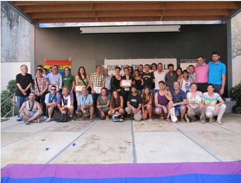
Entrega de premis Ploma Daurada

Total persones ateses a través de l'area de salut H2o: 126