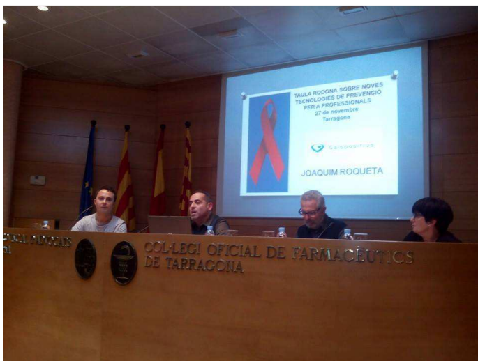
Taula debat- “Noves tecnologies en prevenció del VIH/Sida”

Total persones ateses des de l’area de salut h2o: 1197